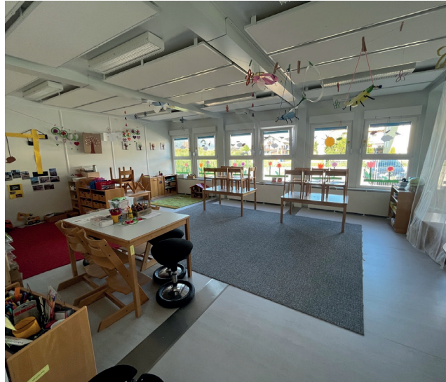
Beispiel: Zukünftiger Gruppenraum

Über die letzten Jahre ist der Bedarf einer Kleinkindbetreuung massiv gestiegen. Mittlerweile werden täglich teilweise ganztags bis zu 40 Kinder im Alter von 18 Monaten bis drei Jahren, aufgeteilt auf drei Standorte (ohne Spielgruppenverein Batschuns), betreut. Aufgrund des zusätzlichen Platzbedarfs hat die Gemeindevertretung in Ihrer Sitzung vom 21.04.2022 den Beschluss gefasst, ein Provisorium mittels Modulbauweise (Container) in Muntlix, nordseitig des bestehenden Kindergartens, zu errichten. Das Provisorium bietet Platz für drei Kleinkindgruppen mit jeweils 12 Kindern pro Tag inkl. Mittagstisch- und Ausweichräumlichkeit für die nächsten 6 bis 8 Jahre. Das Investitionsvolumen für dieses Provisorium beläuft sich auf rund 500.000,00 Euro, welches die Gemeinde ohne Förderungsmittel stemmen muss.