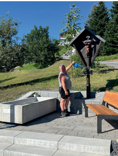
Platte (ehem. Haldenbrunnen)